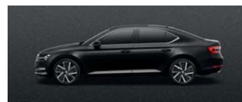
MAGIC BLACK METALLIC