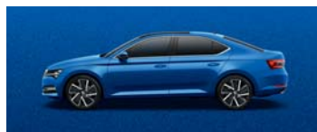
RACE BLUE METALLIC