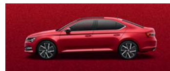
VELVET RED METALLIC