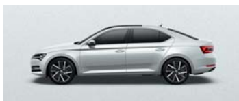
MOON WHITE METALLIC