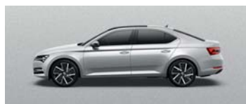
BRILLIANT SILVER METALLIC