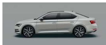
STEEL GREY UNI