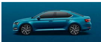
LAVA BLUE METALLIC