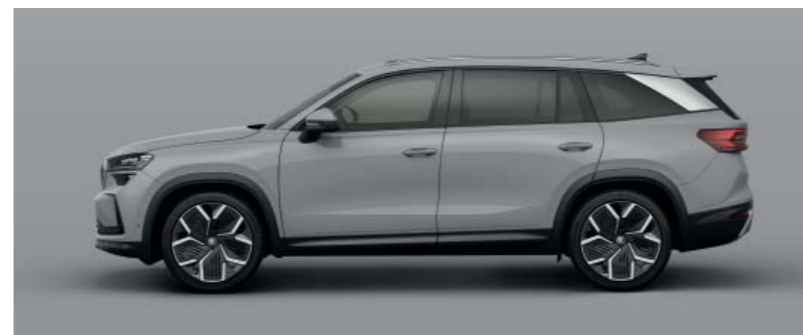
Steel Grey uni