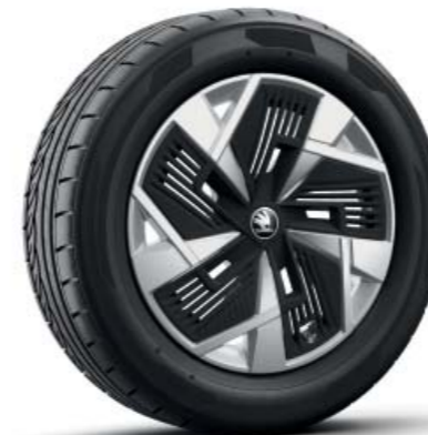
18-дюймові легкосплавні диски Mazeno Aero, сріблясті, аеродинамічні ковпаки (чорні)