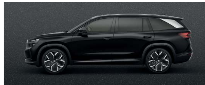
Magic Black metallic