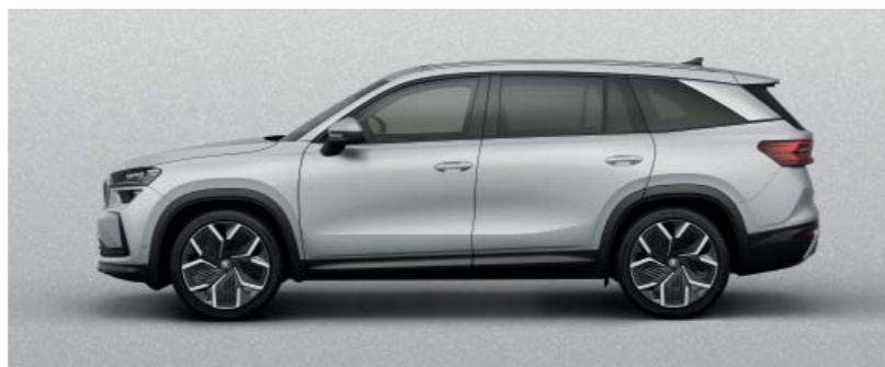
Brilliant Silver metallic