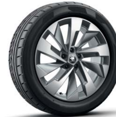
19-дюймові легкосплавні диски Halti Aero, антрацит