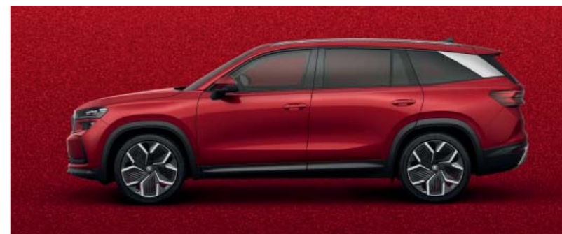
Velvet Red metallic