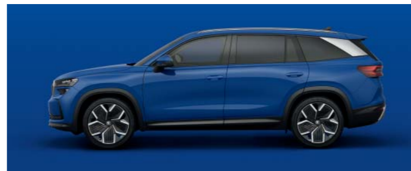
Energy Blue uni