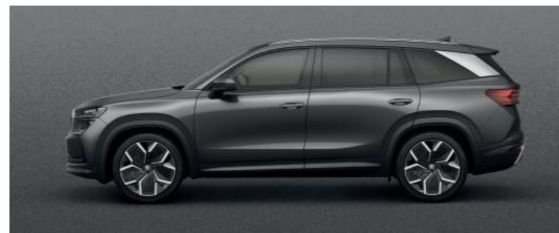
Graphite Grey metallic