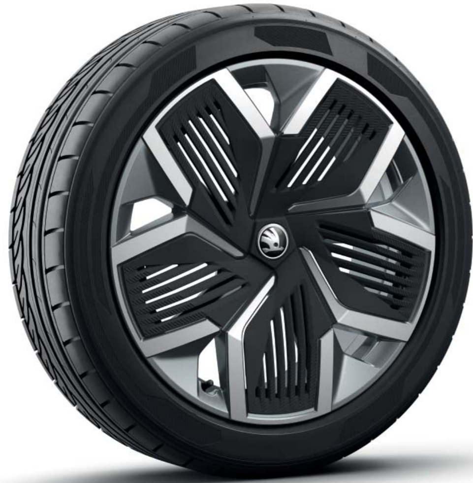
20-дюймові легкосплавні диски Rila Aero, антрацит, аеродинамічні ковпаки (чорні)