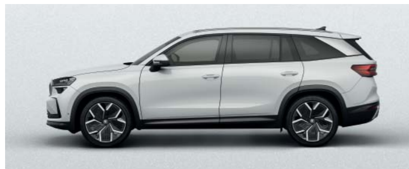
Moon White metallic