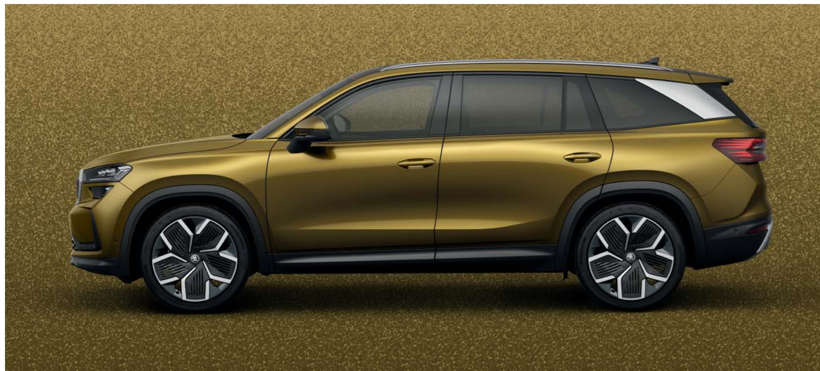
Bronx Gold metallic