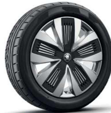
19-дюймові легкосплавні диски Talgar, сріблясті, аеродинамічні ковпаки (чорні)