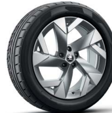
19-дюймові легкосплавні диски Tirsuli Aero, антрацит*