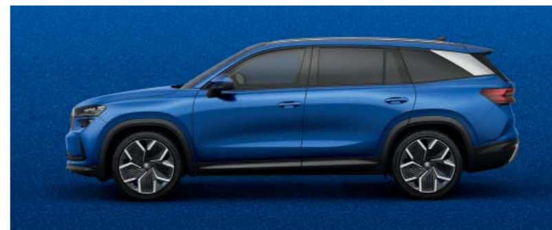
Race Blue metallic