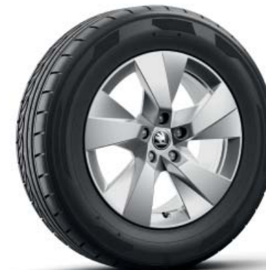
17-дюймові легкосплавні диски Paget Aero, сріблясті