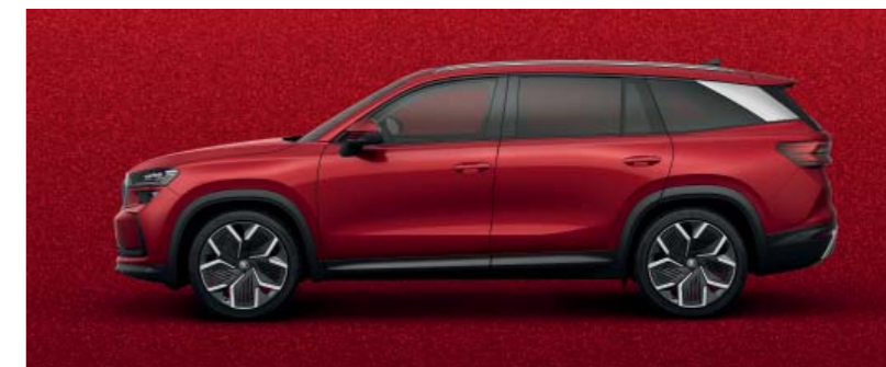
Velvet Red metallic