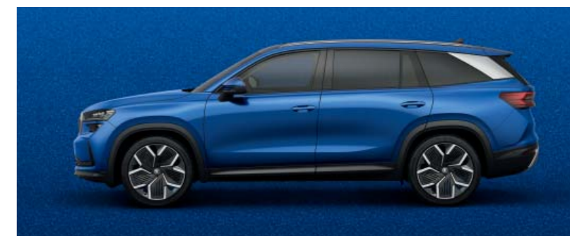
Race Blue metallic