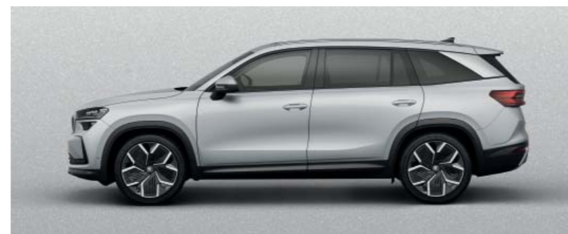
Brilliant Silver metallic