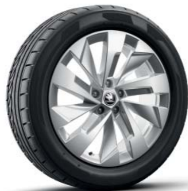
19-дюймові легкосплавні диски Rapeto, сріблясті